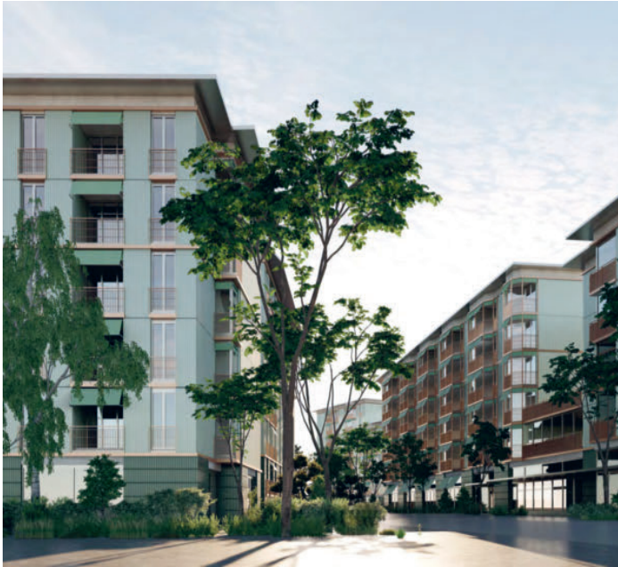
Eine Visualisierung des Projekts Im Drüegg in Schwamendingen.

FH. Nach langen Wartezeiten und vielen bangen Monaten wurde uns im letzten halben Jahr gleich für beide Schwamendinger Ersatzneubauprojekte der Bauentscheid zugestellt.