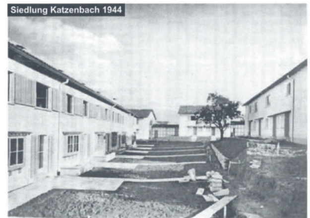
1. Info September 2001, Informationen zum Projekt Katzenbach

Das vorliegende Informationsblatt ist die erste Nummer in einer Reihe, welche bis zum Abschluss der Massnahmen weiter geführt werden soll.