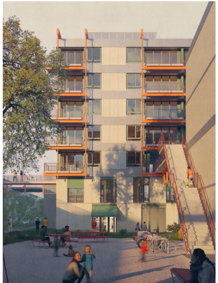
Ziel für das Projekt Neuwiesen ist ein Baustart im Herbst 2026

Nach fast dreijähriger Wartezeit wurde auch für das Ersatzneubauprojekt Neuwiesen Ende 2025 der Bauentscheid zugestellt. Im April dieses Jahres konnten die Verhandlungen für den Totalunternehmervertrag abgeschlossen werden und dadurch kann diesen Sommer mit der Altlastensanierung und dem Rückbau begonnen werden. Die letzten Mieter werden per Ende Mai 2026 ausziehen.