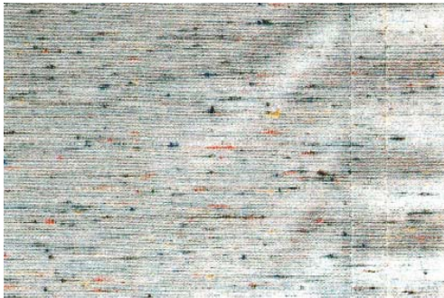
Besispiel Welligkeit im Nahtbereich Exemple ondulation dans les zones des coutures Esempio ondulazioni presso la cucitura