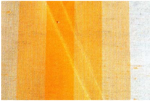
Besispiel Knickfalten Exemple froissures Esempio arricciature