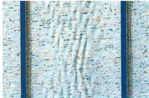
Besispiel Welligkeit im Bahnenbereich Exemple ondulation dans les zones des bords de lés Esempio ondulazioni sulla banda